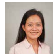
My Le Dao Gastronomie Vietnam