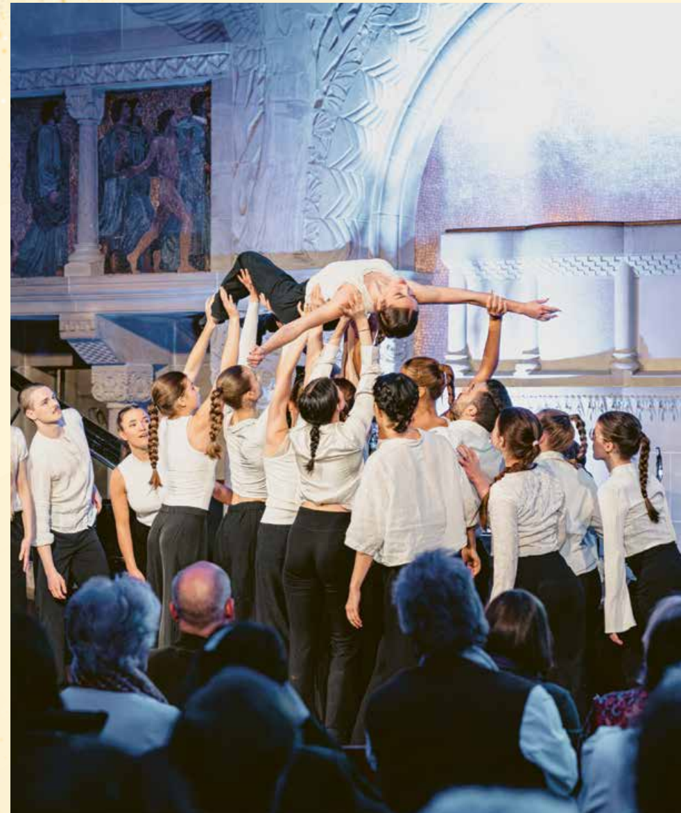
Tanzperformance von Studierenden des Braswell Arts Center Basel am Jubiläumsevent