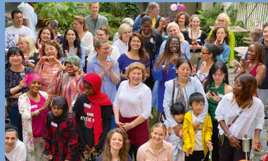
Die Crescenda-Community am Sommerfest