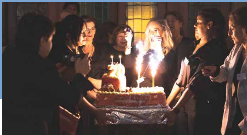
Das Team vom Bistrot Crescenda präsentiert die Geburtstagstorte an der Jubiläumsfeier

K – Küche, SER – Service, SEM – Seminare, HW – Hauswirtschaft