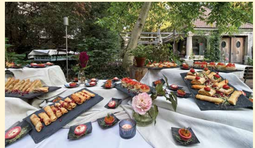
Apéro riche im lauschigen Garten von Crescenda