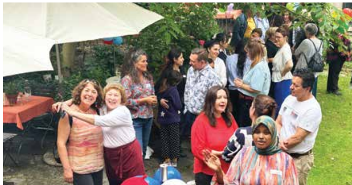
Die Crescenda-Community am Sommerfest im lauschigen Garten

Im lauschigen Garten von Crescenda durften wir im Juni über 80 Gäste an unserem Sommerfest begrüßen. Der Anlass bot den Alumnae, Absolventinnen und aktuellen Programmteilnehmerinnen eine wunderbare Gelegenheit, sich in entspannter Atmosphäre auszutauschen und ihr Netzwerk zu erweitern.